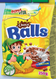
KAKAOVÉ KULIČKY 250 G - 136 486, KAKAOVÉ LUPÍNKY 250G - 136 487