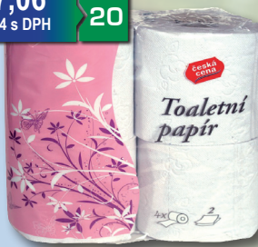
TP 2 VRSTVY 4 KS