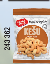
KEŠU PRAŽ. SOL. 60 G