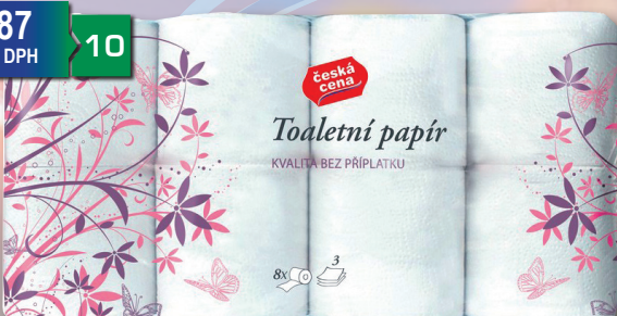
TP 3 VRSTVY 8 KS