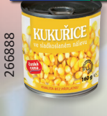
KUKUŘICE ST. P150G