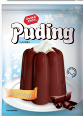
PUDING ČOKOLÁDOVÝ 38 G