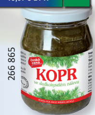
KOPR ST. S 240 ML