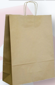
ČC TAŠKA PAPIŘOVÁ - 986 111