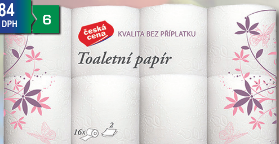
TP 2 VRSTVY 16 KS