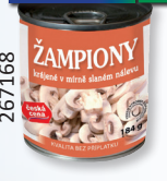
ŽAMPIONY ST. ŘEZY P212G