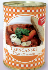
TRENČANSKÝ PÁREK S FAZOLÍ EO 410 G