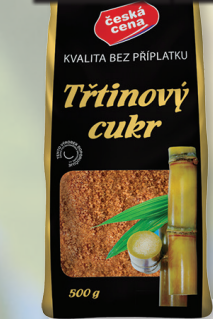
CUKR TŘTIN. 500 G