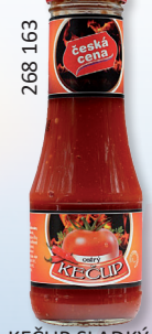
KEČUP SLADKÝ S 500 G