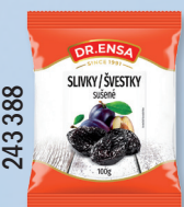
ŠVESTKY SUŠENÉ 100 G