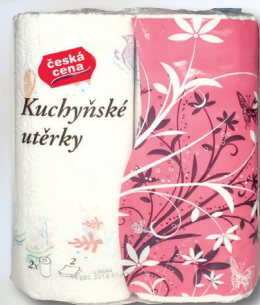
KUCHYŇ. UTĚRKY 2 KS