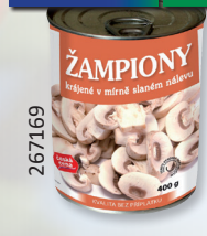
ŽAMPIONY ST. ŘEZY P400G