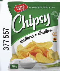
SMETANA S CIBULÍ 70 G