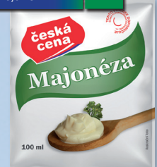
MAJONÉZA 100 G