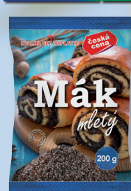
MÁK MLETÝ 100% TERMOSTABILIZOVANÝ 200 G