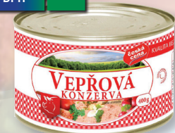
VEPŘOVÁ KONZERVA 45% P 400 G