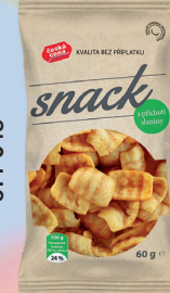
SNACK SLANINA 60 G