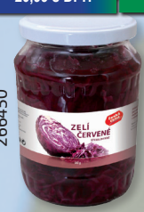
ZELÍ ČERVENÉ TO 680 G