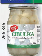
CIBULKA V SLADKOKYS. NÁL. 340 G