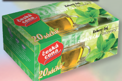
ČAJ ZELENÝ 20 X 1,5 G