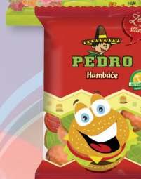
PEDRO SUPER MIX - KYSELÝ - 181 505, SUPER MIX - 181 504, HAMBÁČE - 181 537, MEDVÍDČI - 181 539 80 G