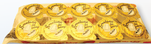
SMETANA DO KÁVY 10 X 10 G