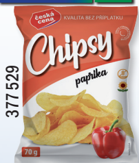
CHIPS PAPIKA 70 G