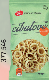
CIBULOVÉ KROUŽKY 70 G