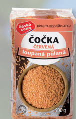
ČOČKA ČERV. LOUPANÁ PŮL.