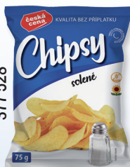
CHIPS SŮL 75 G