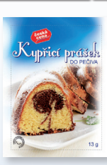
PRÁŠEK DO PEČIVA 13 G