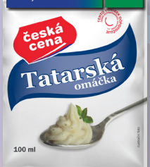
TATARSKÁ OMÁČKA 100 G