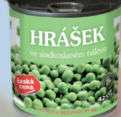
HRÁŠEK ČČ 425 ML - 266 701