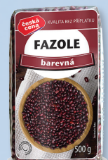
FAZOLE ČERV. LEDVINA