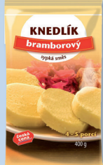
BRAMBOR. KNEDLE 400G