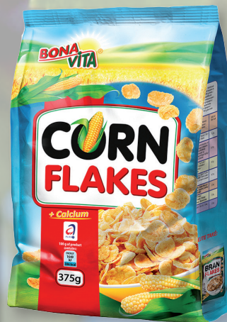
KUKUŘIČNÉ LUPÍNKY 375 G - 136 524