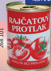
RAJČATOVÝ PROTLAK P 140 G