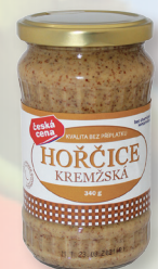
HOŘČICE KREMŽSKÁ - 486 205 PLNOTUČNÁ - 486 321 340 G SKLO