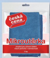
MIKRO UTĚRKA 1 KS