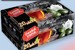
ČAJ ČERNÝ 20 X 1,5 G