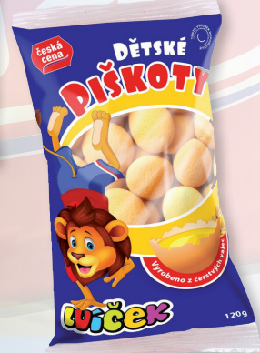
PIŠKOTY DĚTSKÉ LVÍČEK 120 G