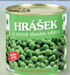
HRÁŠEK ČČ 180 G - 266 700