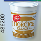
HOŘČICE KREMŽSKÁ 200 G