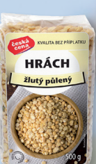
HRÁCH LOUP. PŮL. ŽLUTÝ