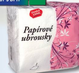
UBROUSKY PAPIŘOVÉ 135 G