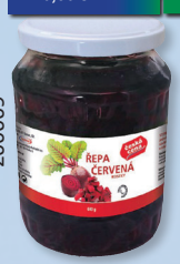
ŘEPA ČERVENÁ TO 640 G