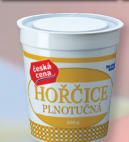
HOŘČICE PLNOTUČNÁ 200 G