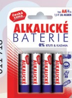
BATERIE TUŽKOVÁ R6 ALK.4 KS