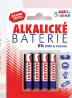
BATERIE MICRO TUŽK. R03 4 KS