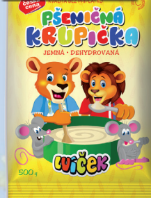
KRUPIČKA ČČ PŠEŇIČNÁ 500 G