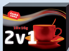
KÁVOV. SPEC 2V1 KRAB10 X 16 G