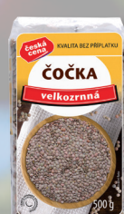
ČOČKA VELKOZRNÁ ČČ. 500 g