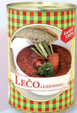
LEČO S UZENINOU EO 415 G