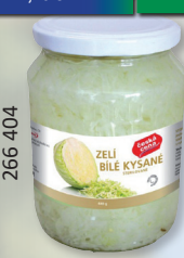
ZELÍ KYŠANÉ TO 680 G