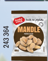
MANDLE PRAŽ. SOL. 60 G