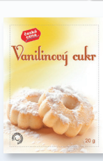
VANILKOVÝ CUKR 20 G