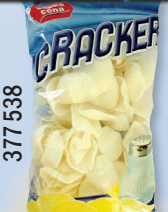
CRACKER SŮL 60 G