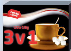
KÁVOV. SPEC 3V1 ČEPOS KRAB10 X 18 G