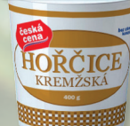
HOŘČICE KREMŽSKÁ 400 G