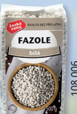
FAZOLE BÍLÁ MALÁ