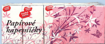
HYG. KAPESNÍČKY 10 X 10 3 VR.