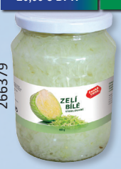
ZELÍ BÍLÉ TO 680 G