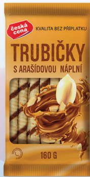
TRUBIČKY ARAŠÍDY, KAKAO 160 G