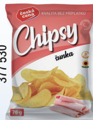
CHIPS ŠUNKA 70 G