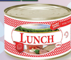
LUNCH 45% P 400 G