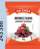
BRUSNICE SUŠENÉ 100 G