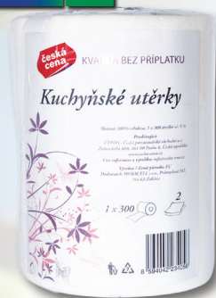
KUCHYŇSKÉ UTĚRKY 2VR 1 X 300