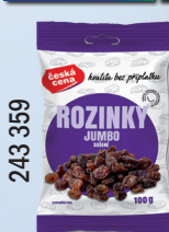
ROZINKY JUMBO 100 G