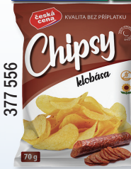
CHIPS KLOBÁŠA 70 G