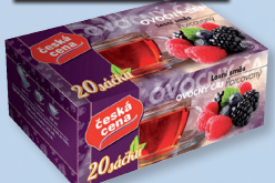
ČAJ OV. LESNÍ PLODY 2X20 G