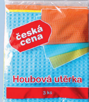
TP 8X200 HOUBOVÁ UTĚRKA 3 KS