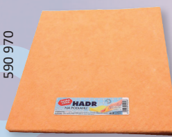
HADR SOFT NA PODLAHU