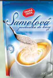
SAMETOVÁ POCHOUTKA DO KÁVY 200 G