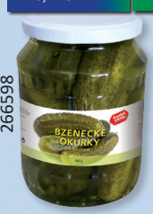
OKURKY 6-9 TO 680 G