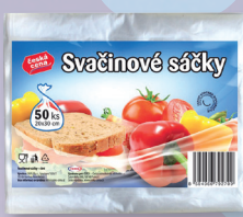
SÁČKY SVAČTINOVÉ 20X30 (50 KS)