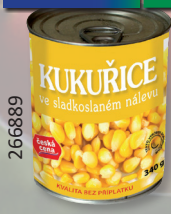
KUKUŘICE ST. P340G