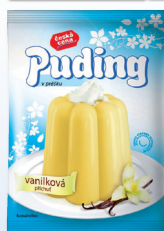
PUDING VANILKOVÝ 38 G