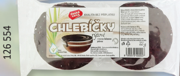
RACIO CHLEBIČKY RÝŽOVÉ 60 G S MLÉČ. POL., S HOŘKOU Č., S JOGURTOVOU