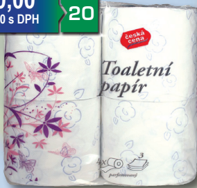
TP 3 VRSTVY 4 KS