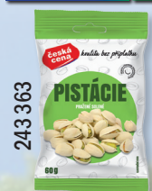
PISTÁCIE PRAŽ. SOL. 60 G