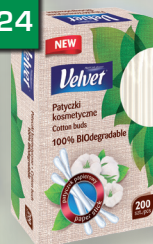
VELVET VAT. TYČINKY 200 KS BIODEGRA DOVATELNÉ