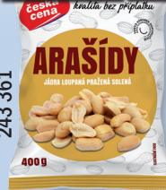
ARAŠÍDY PRAŽ. SOL. 400 G