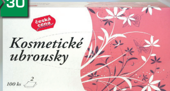
KOSMETICKÉ UBROUSKY 2 VR. 100 KS