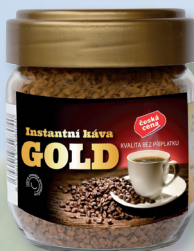
KÁVA GOLD INSTANTNÍ ČČ 100 G