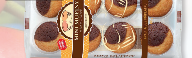
MUFINY MINI MRAMOR 180 G