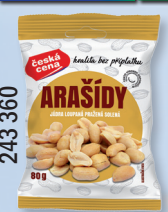
ARAŠÍDY PRAŽ. SOL. 80 G