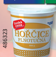
HOŘČICE PLNOTUČNÁ 400 G