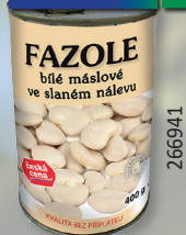
FAZOLE BÍLÁ BIAN. SPAG.